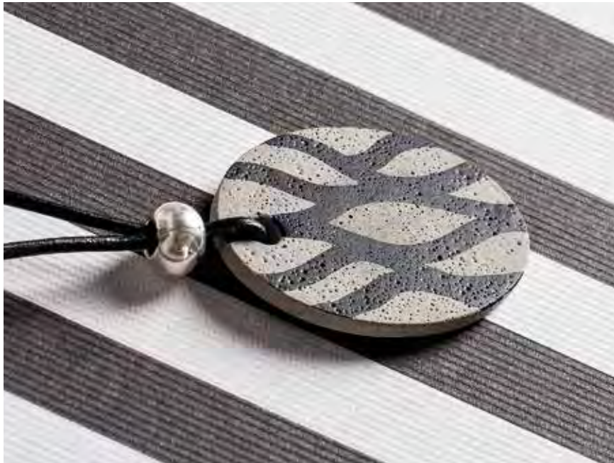
Art. 8301802 + 35007102 ↑