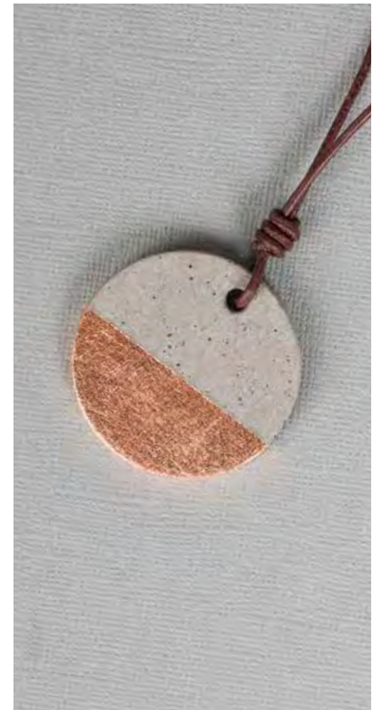
← Art. 14769862