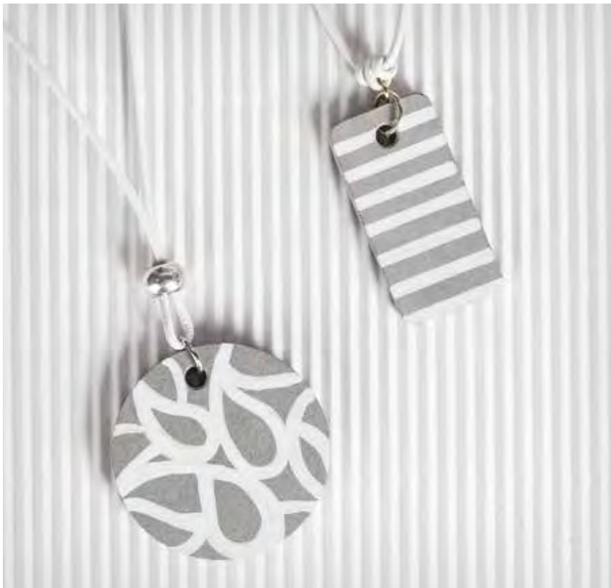
Art. 8301801 + 35007576 ↓