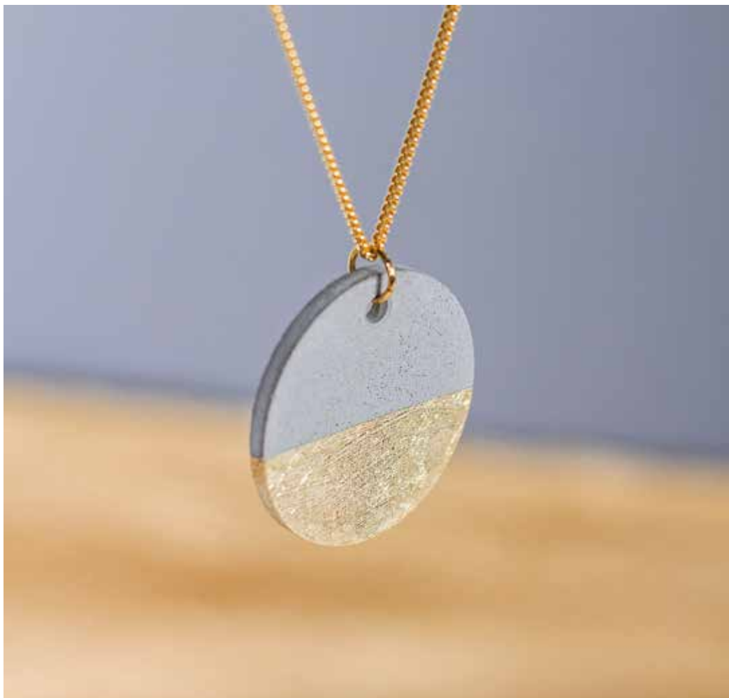
Art. 34166000 ↓